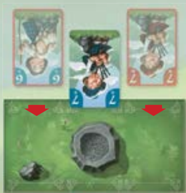
Пример возможного размещения

Игрок должен выбрать 1 из карт жителей в своей руке и разместить её на одном из полей собраний. Карта должна быть размещена напротив или рядом хотя бы с одной другой картой жителя, лежащей лицом вверх.